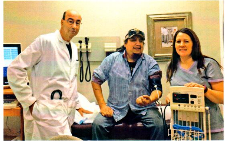
Follow up appointment